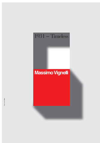
Armando Milani, Massimo Vignelli, 2014.